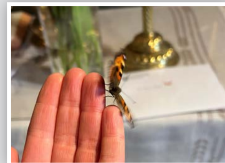
En sommerfugl ønsket prest og menighet god påske første påskedag.