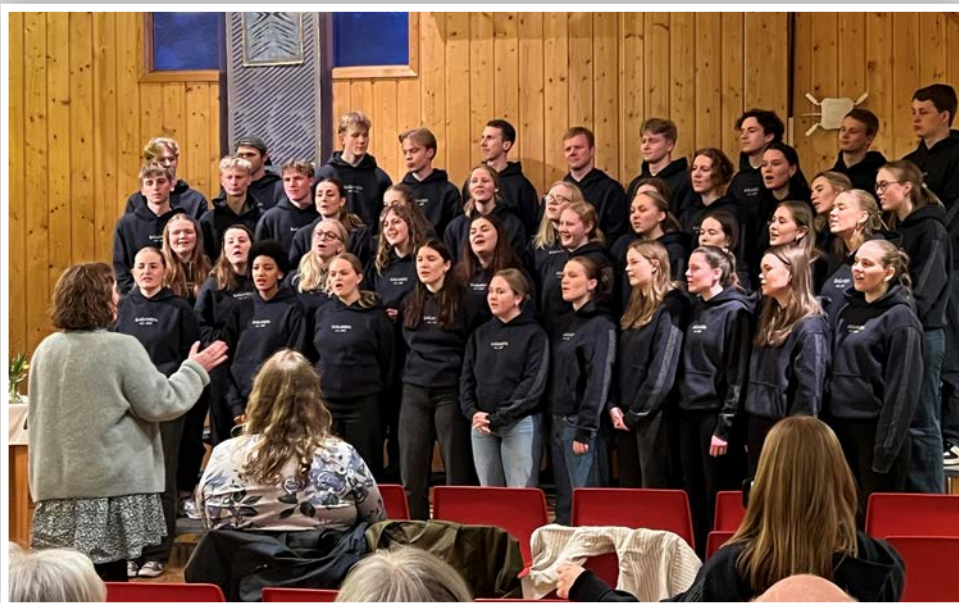
Koret Dynamis fra Sagavoll deltok på en gudstjeneste i mars.