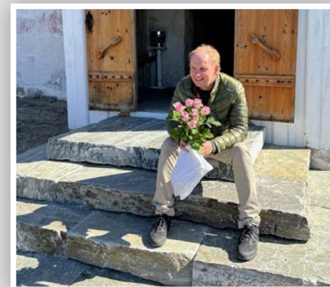
Kyrkjetenaren nyter vårsola.