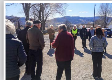
Opptelling på parkeringsplassen etter brannøvinga.