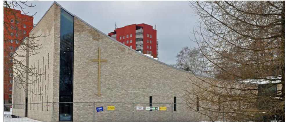
Råbygget til Mustamäe Maria Magdalena kyrkje.