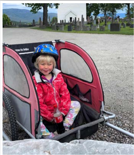
Godt med transport på pilegrimstur 2023.