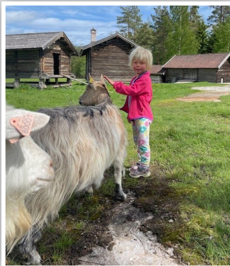
Gode møter på pilegrimsvandringa