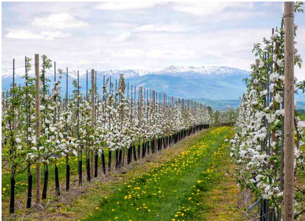
Fruktblomstring på Nes.