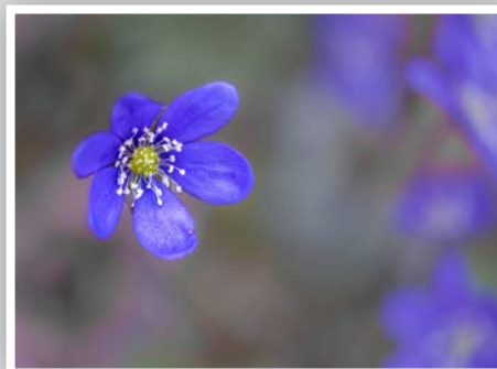
Skogen er full av dei vakreste av dei vakre.