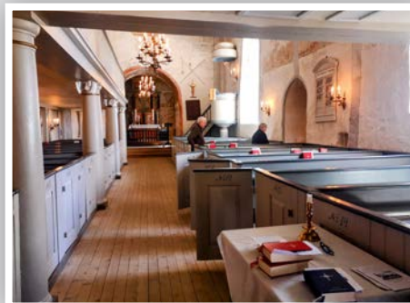
Det gikk raskt å tomme kyrkja under brannøvinga i slutten av april.