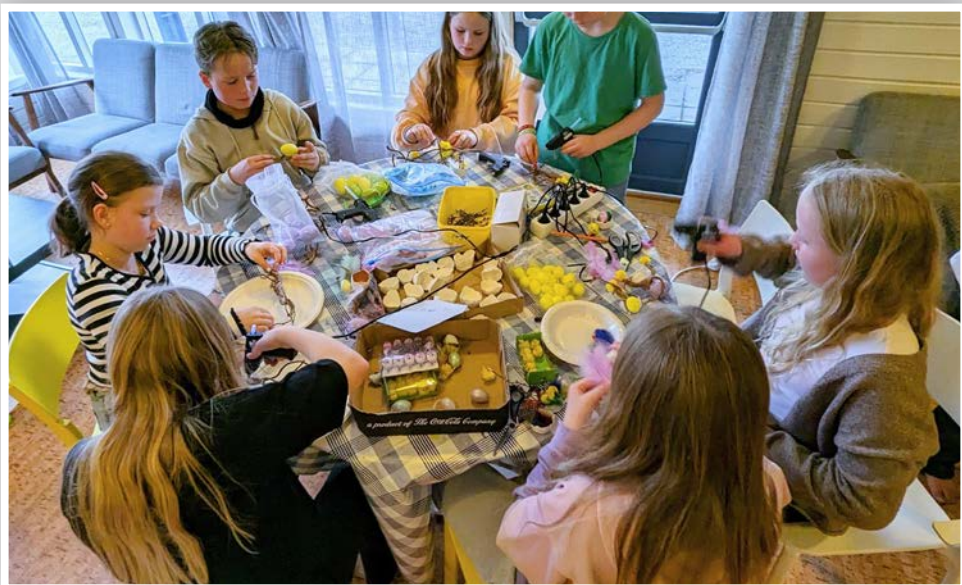
God stemning på påskeverkstaden med tweensa.