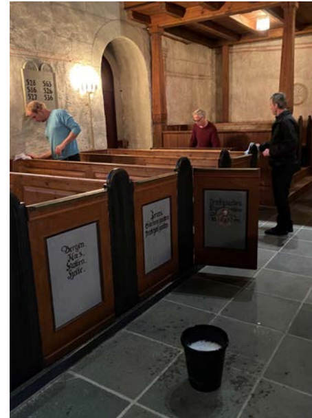
Vaskebotta var hyppig framme i desember.