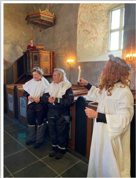
Også de ansatte i barnehagen fikk prøve seg som englekor under ledelse av musikkengelen. Keiser Augustus (Åsne) skimtes i bakgrunnen.