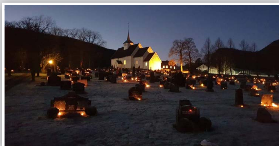
Lyshav ved Sauherad kirke julaften.