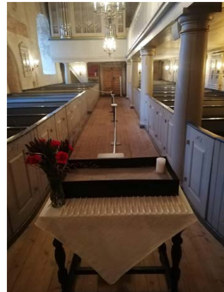
Sauherad kirke var åpen for lystenning julaften. Også her ble smittevernet tatt på alvor.