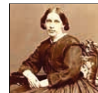
Lina Sandell (1832 – 1903)