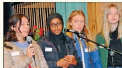
Ungdommer fra det nystartede PRESS på Notodden presenterte aktuelle saker på julemessa.