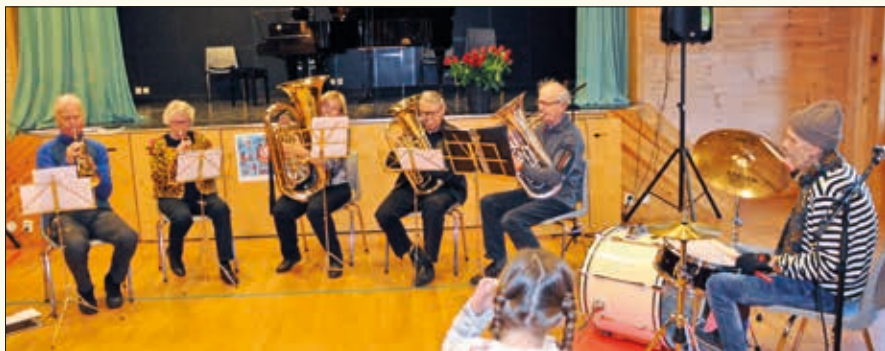
Sauherad musikkorps har spilt på Redd Barnas julemesse i svært mange år.

Julemessa ble arrangert på Idunsvoll/Sauherad sambruksanlegg lørdag 1. desember 2018. Mange sambygdinger koset seg med hyggelig samvær, litt mat og drikke i vår lille kafé.