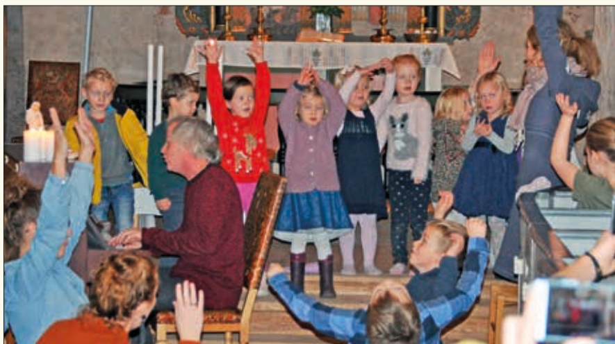
Barn fra 4-årsklubben og søndagsskolen sang. Fireåringene fikk også sin Kirkebok.