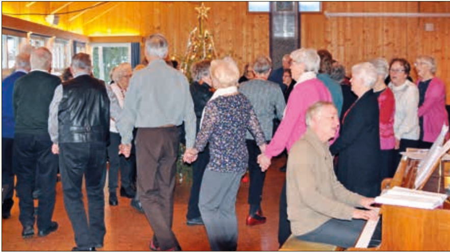
8. januar var det formiddagsjuletefest! Omtrent 50 var tilstede, og mange var med på å gå rundt juletreet.