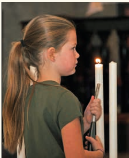
Ingelin tente det første lyset i adventskransen.

Første søndag i advent startet et nytt kirkeår. Det ble feiret med familiegudstjeneste i Sauherad kirke.