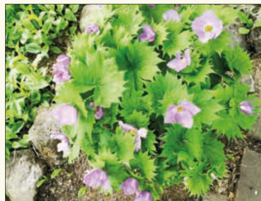
Glaucidium palmatum, har ikkje fått norsk namn, men oversatt fra engelsk er det japansk skogsvalmue

Grønne Midt-Telemark. Det er eit samarbeid mellom Telemark botaniske forening, Sauherad Bygdekvinneleg, Midt-Telemark sopp- og nyttevekstforening, Evju Bygdetun, Bærekraftig liv i Bø og Bø og Sauherad hagelag. Me har etablert heimeside https://gronne-midt-telemark.no/ og facebook-side www.facebook.com/gronnkultur der du kan finne informasjon om grønne arrangement og aktivitetar.